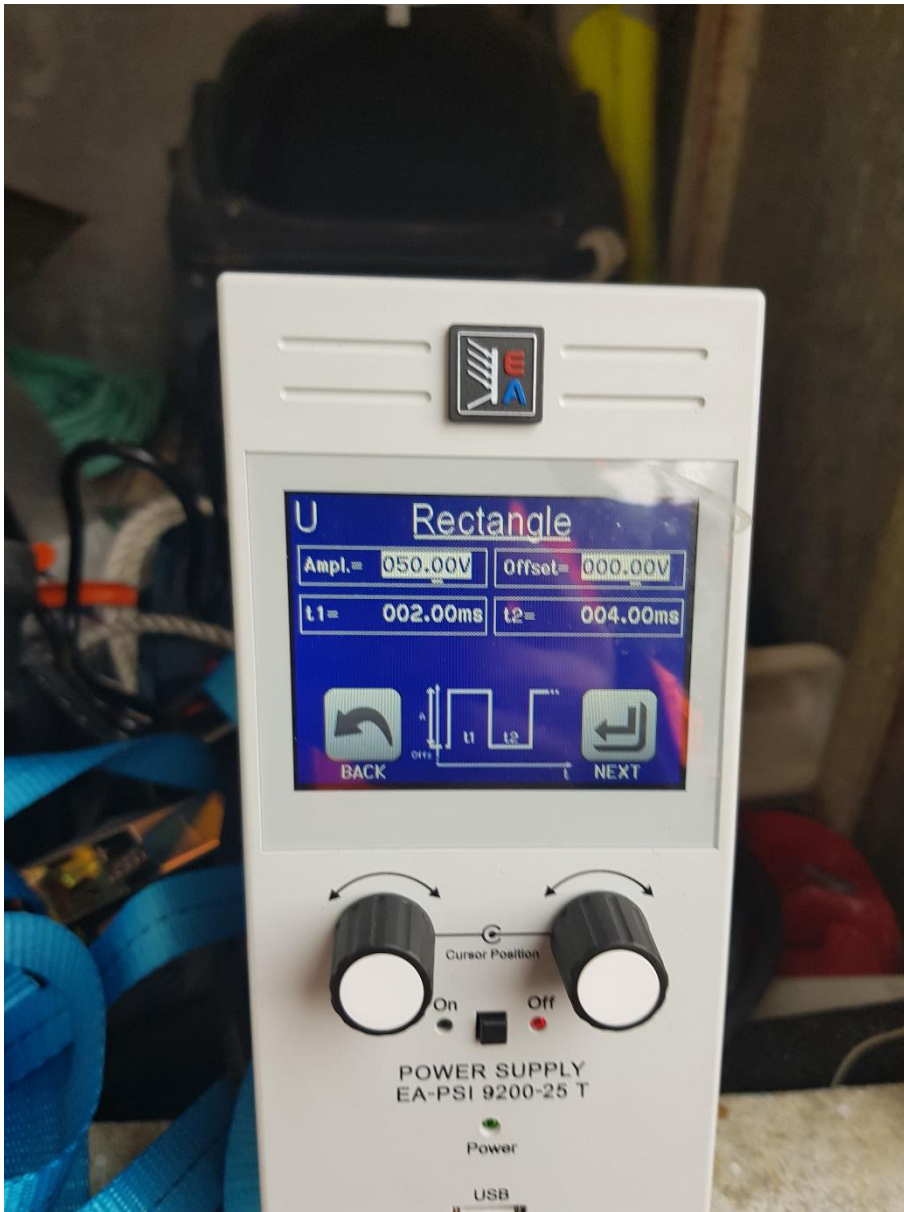
Figur 2 EA Elektro-Automatik Bench Power Supply, 1.5kW, 1 Output, 0 → 200V, 25A